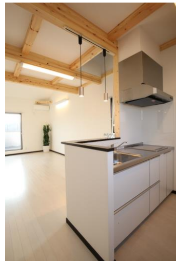
キッチンから・・・